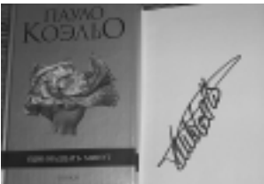
Сов, но никто не хотел уходить, но повидая Пауло, и он принял всех до последнего посетителя.

Писатель думает закончить свое турне по нашей Родине 30 мая во Владивостоке, а оттуда уже отправится к себе в Бразилию, где обещает в кратчайшие сроки выпустить очередную шедевр.