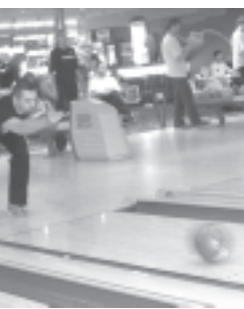
Самые молодые спортсмены