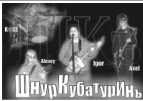
Продолжаем рассказывать о рок-командах города. На этот раз речь о группе «Шнур Кубатурин». Последний раз их можно было увидеть на фестивале «Братская Энергия 4», выступление группы оставило о себе очень хорошие впечатления. О том же, как развивалась группа с первого дня, вы прочитаете ниже.