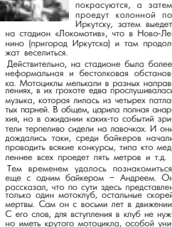
Продираясь сквозь толпу мотоциклистов, из оссибх девчонок и зевак, я наткнулся на одного явно крутого, но отчего-то печального человека.