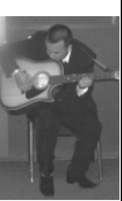
Одновременно говоря, лично мне жанр шансона не очень нравится, может быть лет через 15, когда мне будет под 40, до меня дойдет вся его прелесть.